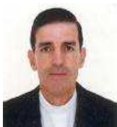
Monseñor Fidel León Cadavid, Obispo de Quibdó

Para la Iglesia: “Este es un trabajo religioso con un compromiso social y de acompañamiento con la comunidad en los múltiples intensos de desplazamientos y resistencia contra los grupos armados ilegales”.