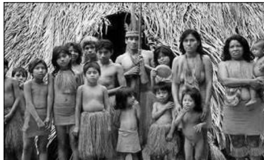
La zona en la que hoy se encuentra Girardota fue habitada por los indígenas Nutabes y Yamesés, que se dedican básicamente a la agricultura.

El desarrollo de la antropología en los grandes países ha ayudado al reforzamiento de la identidad como naciones, ya que eventos, como por ejemplo, las guerras mundiales dejan huellas en quienes sufren pérdidas y muertes, rasgando en algunos casos, los lazos culturales existentes en el país. Sin embargo, la antropología como ciencia en busca del beneficio colectivo, se adentra en la búsqueda de métodos para mejorar el buen vivir del hombre.