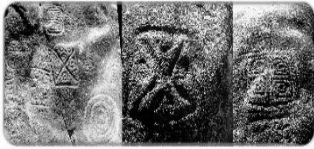
PETROGLIFOS VEREDA DE SAN ESTEBAN GIRARDOTA ANTIOQUIA 3.000 AC.