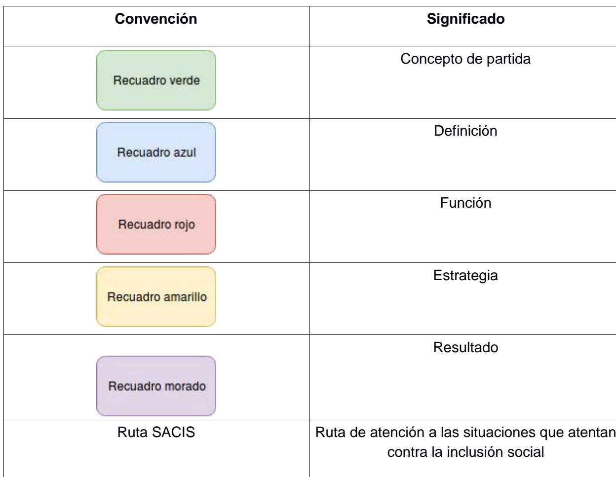
Tabla 1. Convenciones para interpretar el esquema metodológico del OIS

En la tabla 1 se presentan las convenciones y su significado para comprender mejor la propuesta del OIS y los mapas que describen sus características.