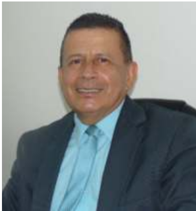
Por: Jairo de Jesús Álvarez / Rector

En la Institución Educativa Abraham Reyes, durante el año 2018, continuamos con grandes propósitos que se orientan hacia el ofrecimiento de una educación con calidad pensando siempre en la formación de auténticos ciudadanos y ciudadanas. Todos estos retos, deben llevar a todos los integrantes de la comunidad educativa a tomar con mucha responsabilidad y compromiso todas las obligaciones como guías y orientadores de la historia de los estudiantes del plantel.