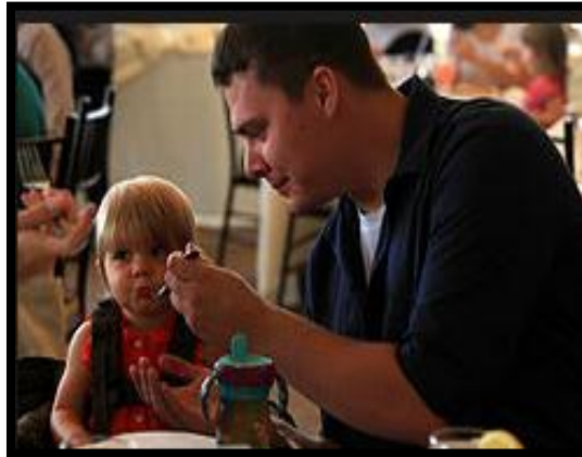
Felicidades a todos Los Padres de Nuestra Institución.