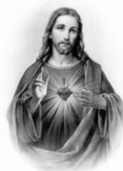
Sagrado Corazón de Jesús, en vos confío.