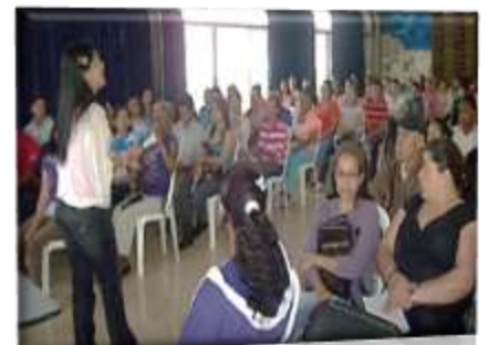
ESCUELA DE PADRES

"NOSOTROS SOMOS LOS MEJORES" E- mail ie.rodrigolarabonilla@medellin.gov.co CRA 25 No 69 D 35 Telefax 2849094