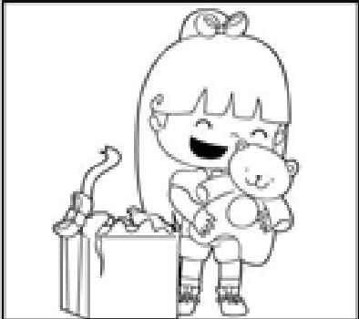
Aceptar y valorar lo que me brindan y no pedir siempre más