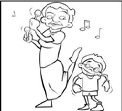
Respetar los gustos de los demás

5. Observa las siguientes imágenes sobre la convivencia en familia y colorea la que consideres más importante y explica el por qué: