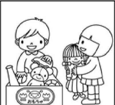
Ponerme de acuerdo y ser considerado con el trabajo y las obligaciones de todos