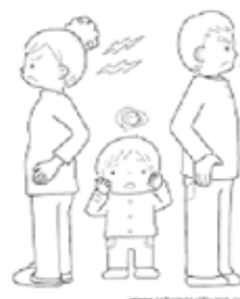
Familia de padres separados

4. Observa y explica las características de cada uno de los tipos de familia: