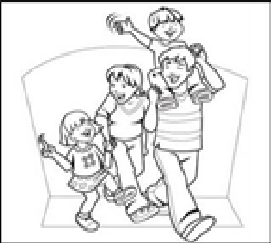
Alegrarme por los logros de los demás y ser cada día mejor