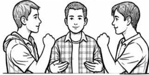
Resolución de Conflictos

Explica dos formas pacíficas de resolver el conflicto.