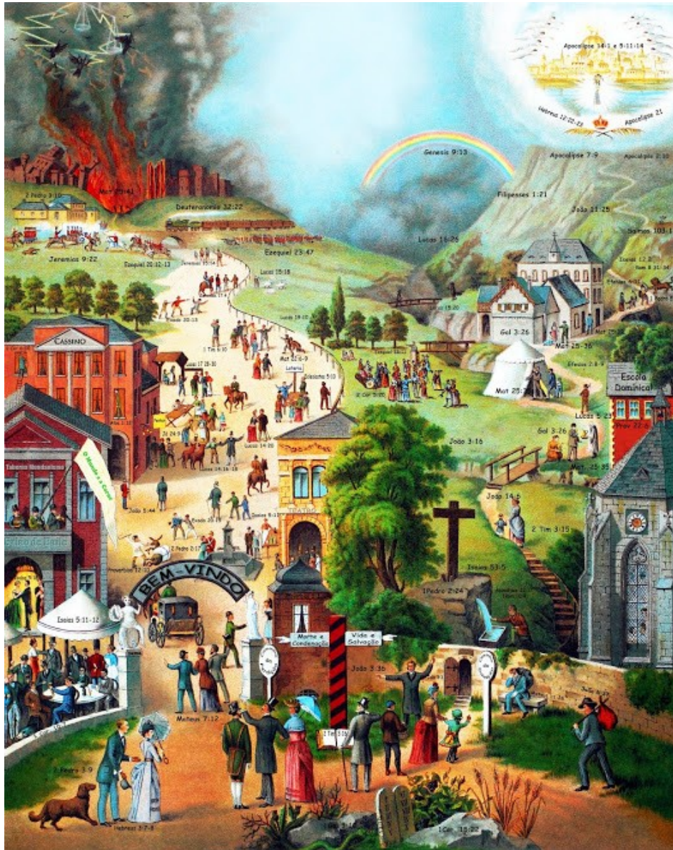
Imagen 1: “Los dos caminos”, autor anónimo.