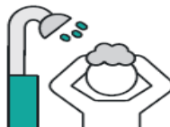
Take a shower