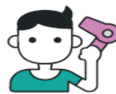
Dry your hair