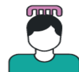
Brush your hair