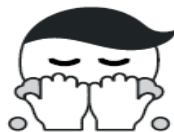
Wash your face