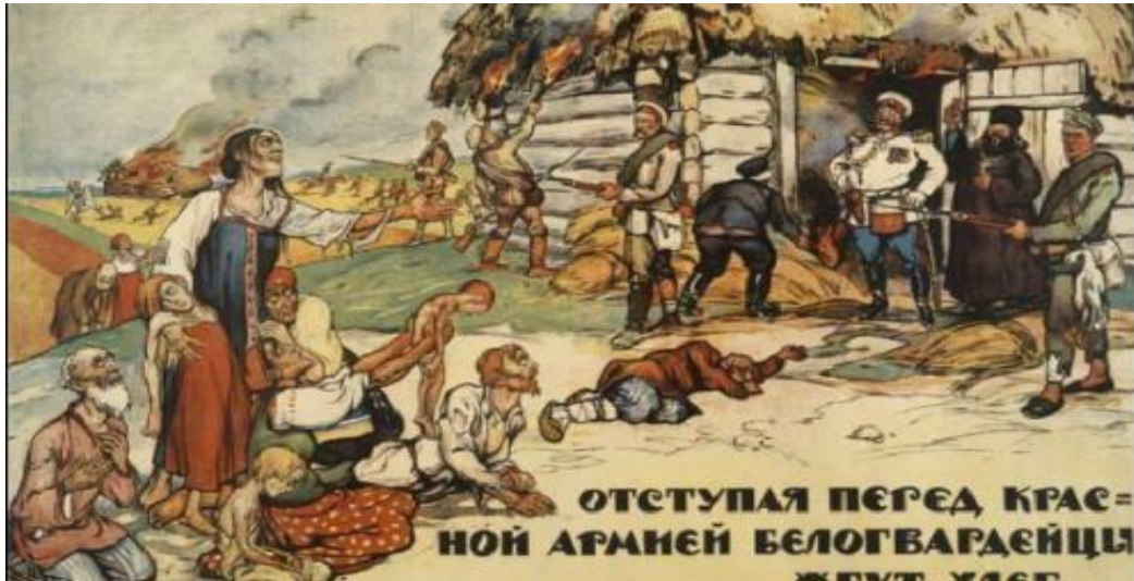
propaganda del ejército rojo contra el ejército blanco

Realiza el análisis de la siguiente propaganda y responde: