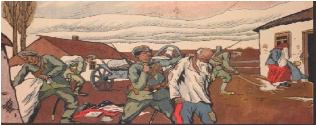
propaganda ejército blanco contra el ejército rojo