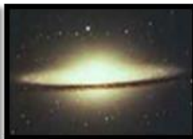
Lenticular (Drum 23)