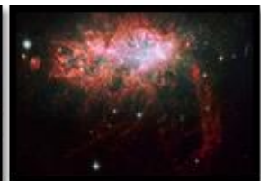
Irregular (NGC 1569)