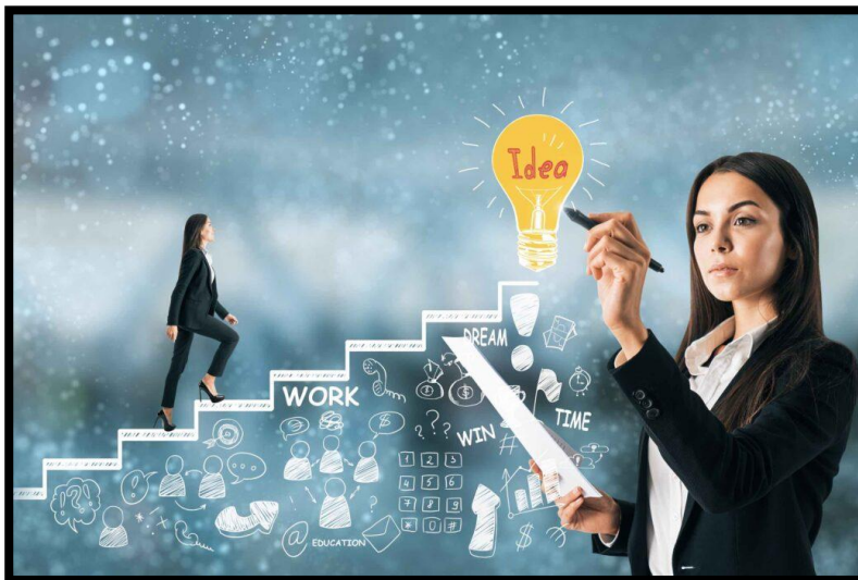
Imagen tomada de: