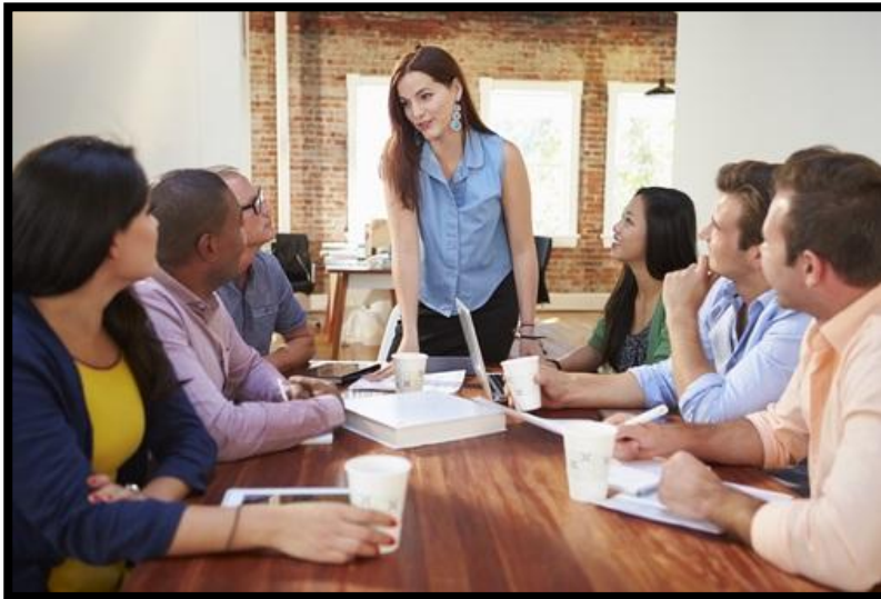
Imagen tomada de: Talent Street. (2015).

https://www.equiposytalento.com/talentstreet/noticias/2020/01/22/las-claves-para-que-una-empresa-se-convierta-en-el-mejor-lugar-para-trabajar/3866/